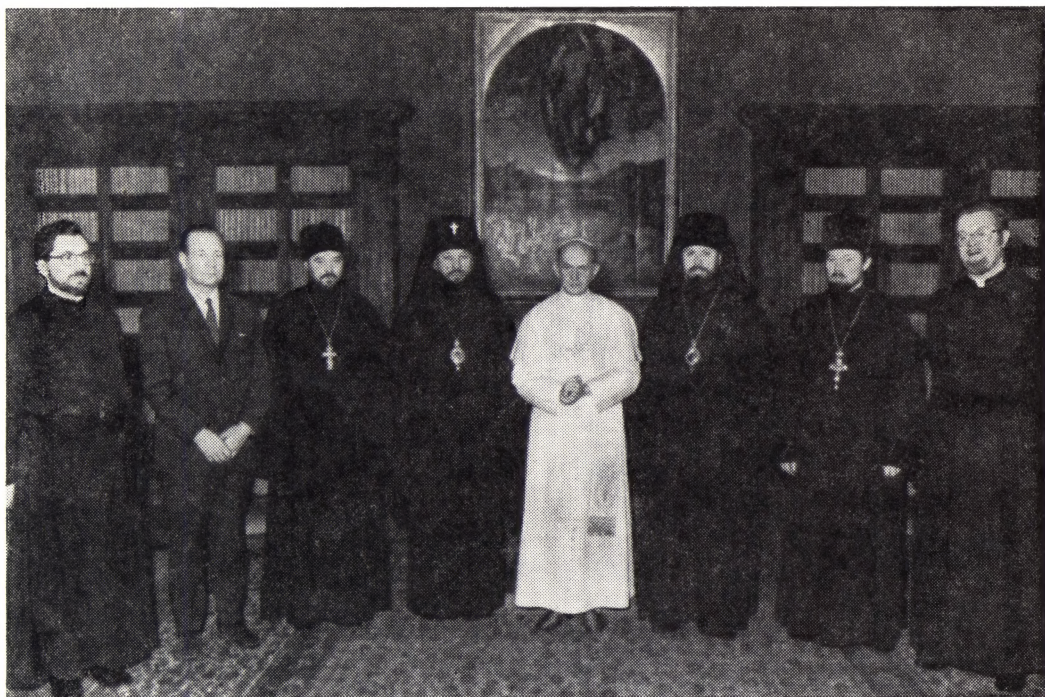
Группа паломников Русской Православной Церкви, совершавшая поездку к древним общехристианским святыням Италии, на приёме у Папы Павла VI в Ватикане 13 декабря 1973 года